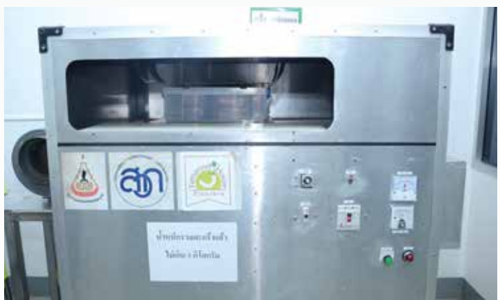
เครื่องกำจัดมอดมะขามด้วยคลื่นความถี่วิทยุ